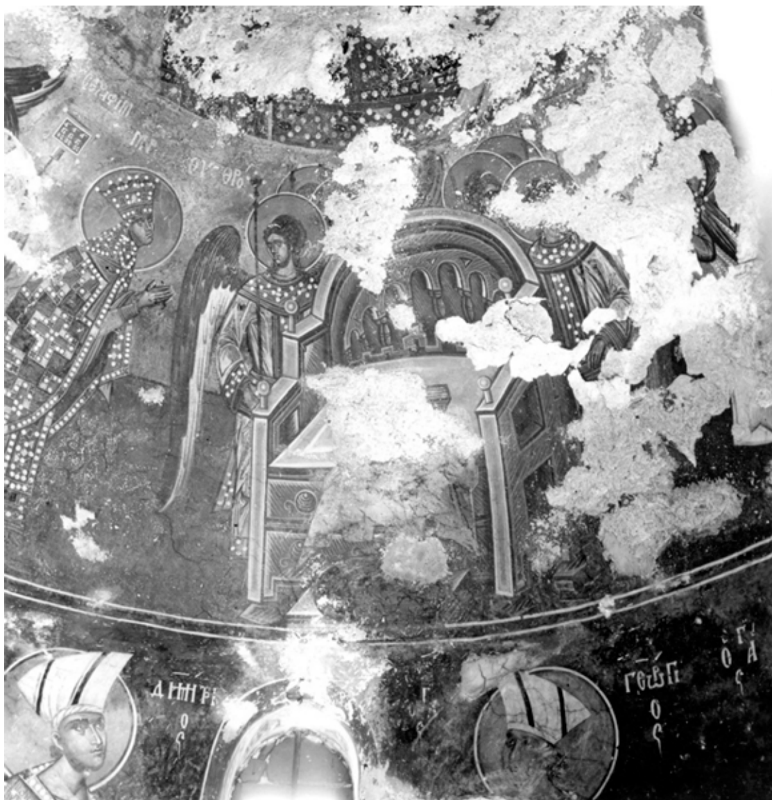
2. Хетимасија со Богородица Царица, Ангели и Цар Давид, манастир Трескавец

каде што на страничните крила повторно се илустрирани само светите војни, тој е во друштво на св. Евстатиј од Плакида. Гледајќи дека во средновековниот период св. Евстратиј, преку својата маченичка судбина и изведените чуда уживал углед како посредник – застапник за спас на човечкиот род, можеме поцелосно да ја согледаме и неговата улога во северозападната купола на манастирот Трескавец (ок. 1340).