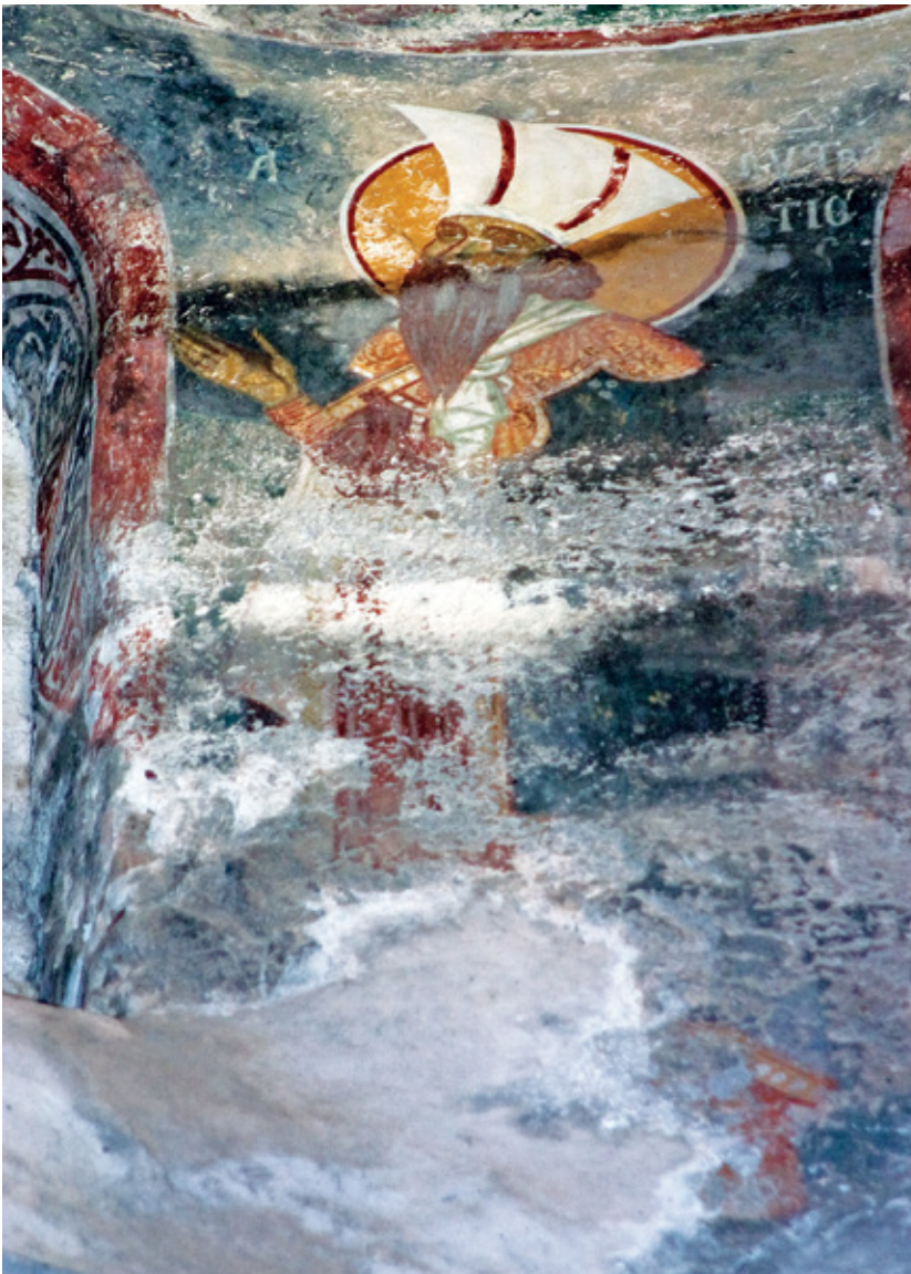
3. Св. Евстратиј, манастир Трескавец

седум ангели со сфери во рацете. Во зоната под нив, меѓу прозорците се претставени светители од категоријата на светите војни, облечени во благородничка облека, со поглед кон престолот и десната рака испружена кон него, додека во левата држат скиптри 54 . Толкувањата на оваа сложена тема се содржани во нејзино идентификување како Небесен двор, 55 на кој му се надоврзува и есхатолошка компонента како алузија на Страшниот суд 56 и застапничката улога на светители-