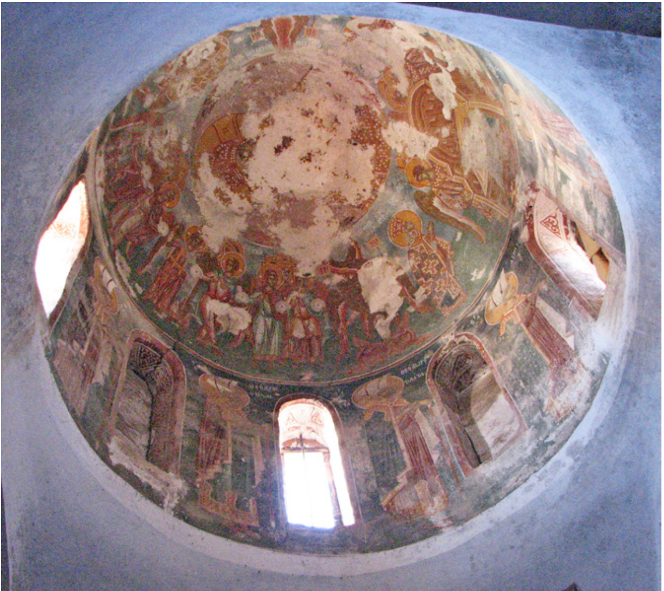
1. Поглед кон северната купола на Трескавец

во, Нерези и северозападната капела на Св. Лука – Фокида, на деловите од црквите кои служеле или како гробни капели, или како места за комеморација. Според неа, улогата што им е доделена е второстепена, додека како главни застапници се јавуваат светите војни и светите врачи. 50